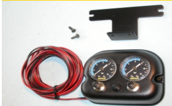
IL KIT B20 CON MANOMETRI RETROILLUMINATI