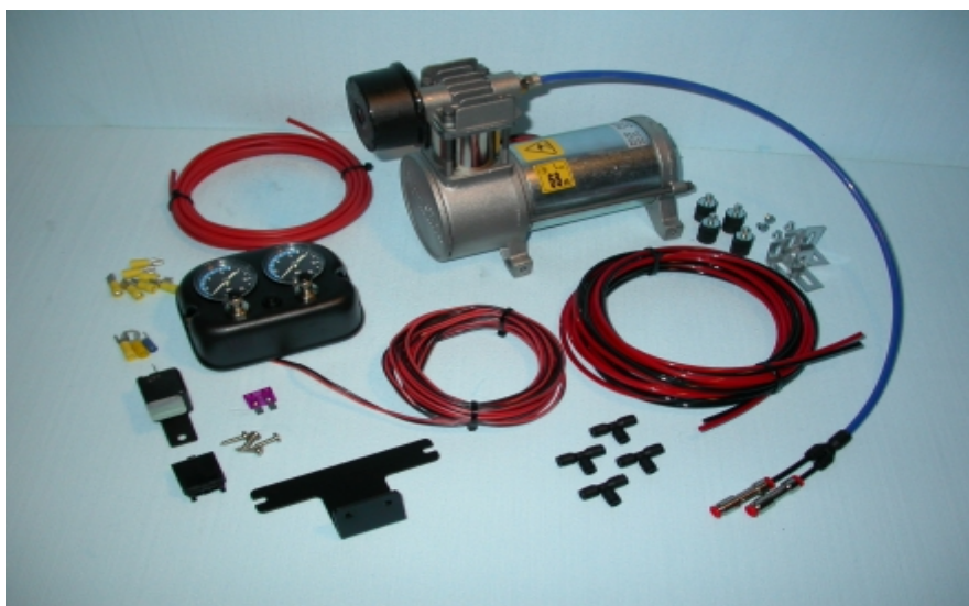
IL COMPLESSIVO B52

La centralina per la variazione autonoma d'assetto B52 è il più importante fra gli accessori BITOP. Con il B52 puoi avere in qualsiasi momento la possibilità di variare la pressione nelle sospensioni senza fastidiose soste per collegarti ad un compressore esterno. Dotata di una circuitazione essenziale ma molto funzionale, permette tutte le operazioni di controllo con la massima affidabilità in quanto priva di apparecchiature delicate (elettrovalvole, pressostato ecc.) che, col tempo, causano malfunzionamenti e perdite d'aria. Il compressore in dotazione è di tipo professionale ed è completo di antivibranti per la massima silenziosità di esercizio. Posizionando il pannello dei comandi a cruscotto, si possono operare variazioni di altezza e di assetto direttamente dal posto di guida anche in fase di marcia. Per una perfetta visibilità notturna, i manometri presenti di serie nel kit, sono retroilluminati. Per i veicoli di ultima generazione (vedi listino) è possibile richiedere, senza aumento del costo, uno specifico pannello comandi/manometri in acciaio verniciato che si integra perfettamente nel cruscotto. Il montaggio è velocissimo grazie alle dimensioni ridotte di componenti e tubazioni ed alle chiare istruzioni in corredo. Avendo un costo, praticamente dimezzato rispetto alle tradizionali centraline, questo dispositivo è consigliabile per tutte le applicazioni BITOP.