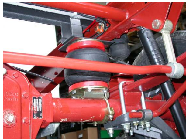
IL COMPLESSIVO MONTATO