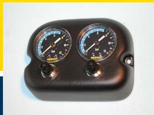
IL KIT MANOMETRI "B18" foto piccola