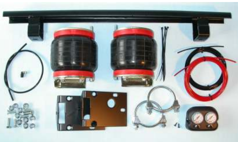
IL COMPLESSIVO "B172" foto grande

Il kit è corredato da: chiare istruzioni, l'occorrente per il montaggio, e valvole di gonfiaggio integrate con speciali manometri per il controllo delle pressioni.