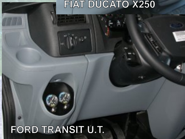
FORD TRANSIT U.T.