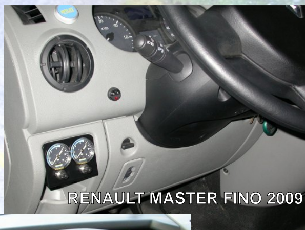
RENAULT MASTER FINO 2009