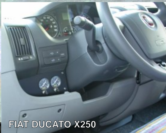
FIAT DUCATO X250

-Ulteriormente ampliata la gamma dei manometri da cruscotto-