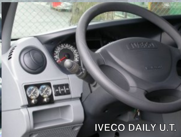
IVECO DAILY U.T.