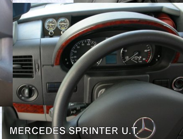
MERCEDES SPRINTER U.T.